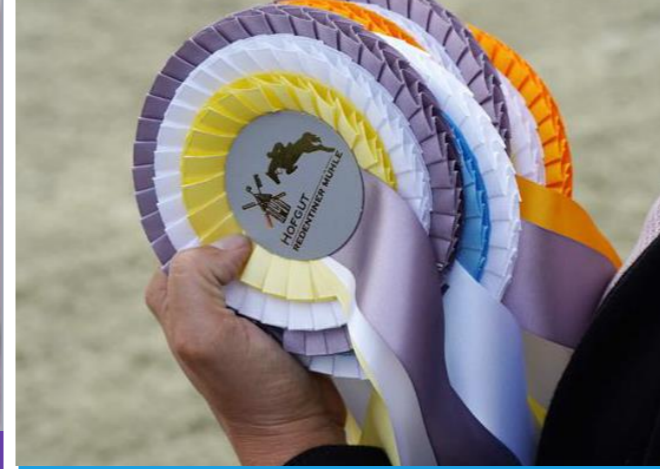
Bedruckung von Werbematerialien